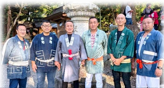
PTA本部役員と学運協中神輿担当者

これに賛同される副会長の皆さん。深い郷土愛を感じました。渡御に参加した生徒にも、そうでない生徒にも、とにかく五日市の全ての子供たちを地域全体で見守り育んでいこうとする熱意を感じました。