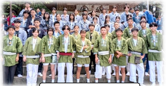
9月28日の参拝会終了後

今年のPTA組織が確立されたと同時に、細部に渡って企画・運営・渉外・調整を努めてくださり、中神輿渡御の道標を整えてくださいました。(左下写真は同6名)