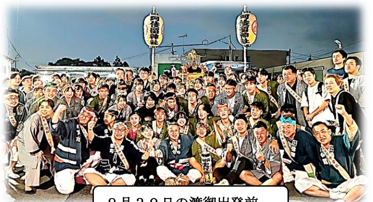
9月30日の渡御出発前

「俺は子供たちのためだけを想ってPTA会長を引き受けた訳じゃない!五日市のためにやるんだ。子供たちに五日市の文化を伝えていくことは、五日市の街を守るためなんだ!俺と一緒にPTAをやって、五日市を盛り上げていこーぜ!」